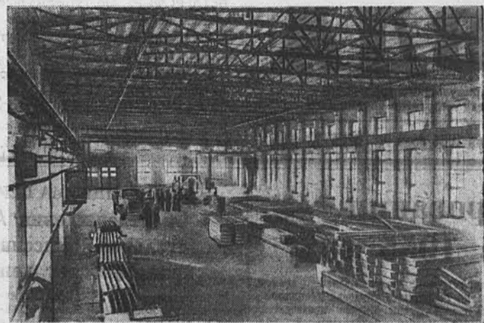
В нынешнем году трест «Стройгиз» построил и сдал в эксплуатацию цех железобетонных изделий и цех арматуры для железобетонных конструкций. Они будут выпускать в год 6 тысяч кубометров железобетонных конструкций и 3 тысячи тонн арматуры.

Цехи оснащены механизмами и оборудованием, что способствует росту производительности труда рабочих. В арматурном цехе установлены автоматический станок для выкладки и резки арматуры конструкции Носенко, механический станок для гнуть арматуры, электрические машины для точечной сварки каркасов и сеток. Грузово-разгрузочные работы в цехе железобетонных изделий осуществляются местными кранами грузоподъемностью пять тонн.