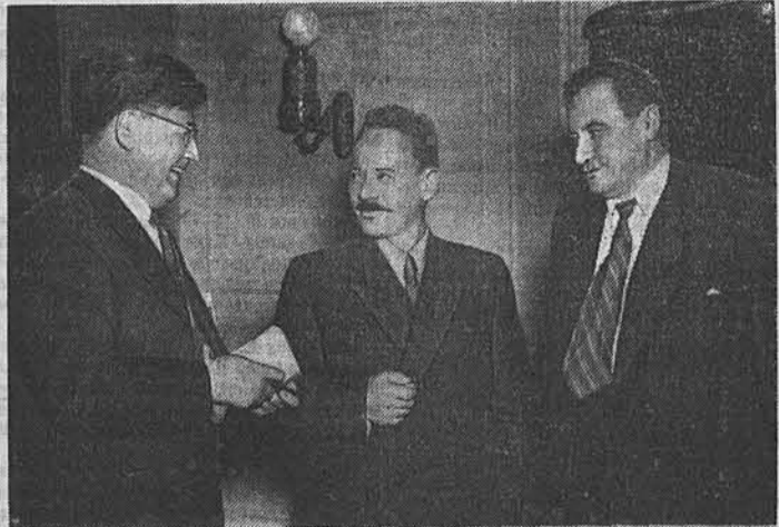
Москва. Второй Всесоюзный съезд советских писателей. На снимке (слева направо): делегаты съезда А. Сурков, М. Шолохов и В. Катаев.