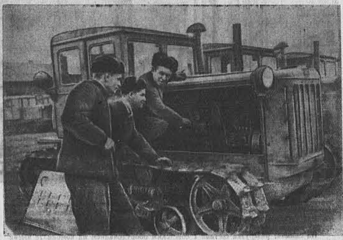
Кулундинская МТС перевыполнила квартальный план ремонта тракторов. Из мастерской выгнано 45 машин.

СЛАВГОРОД. (По телефону). Коллектив Некрасовской МТС досрочно выполнил свои социалистические обязательства по ремонту машин. И в весеннем ремонте готовы все тракторы и прицепные машины. На линейку поставлено 89 тракторов, 92 плуга, 96 селенок, 87 культиваторов, 25 лущильников. Отремонтировано также 12 комбайнов и 15 самоходных машин. Ремонт хлебоуборочных и сеноуборочных машин продолжается успешно.