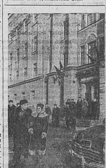
На снимке: в день выборов у избирательного пункта № 50 г. Барнаула.

В 2 часа дня все избиратели села исполнили свой гражданский долг.