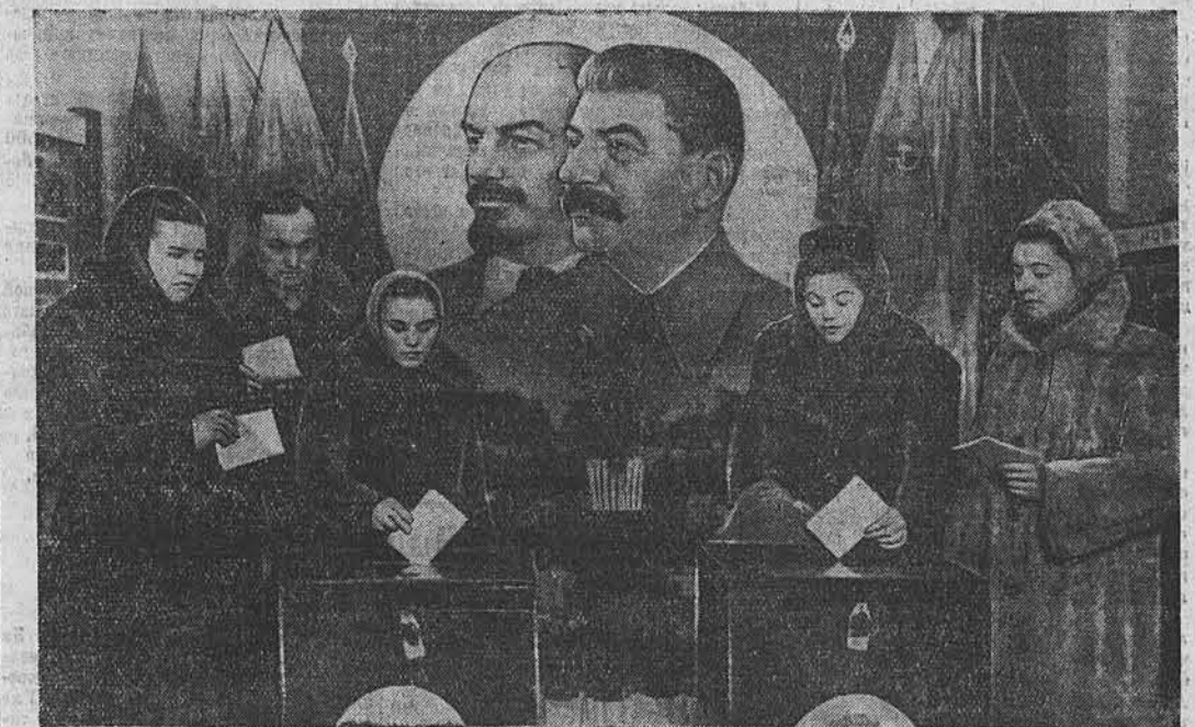
На снимке: на избирательном пункте № 61 (г. Барнаул).

До позднего вечера на избирательных пунктах демонстрировались кинофильмы, выступали коллективы художественной самодеятельности.