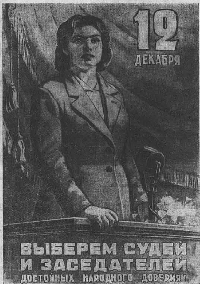
Плакат художника И. Комиларца.

Все на выборы! Отдадим голоса за кандидатов нерушимого блока коммунистов и беспартийных!