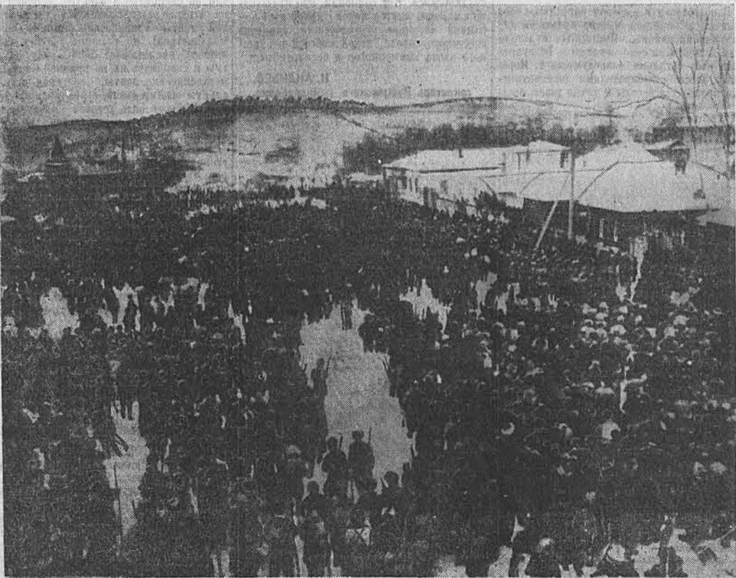
На снимке: вступление партизан в г. Барнаул 10 декабря 1919 г.