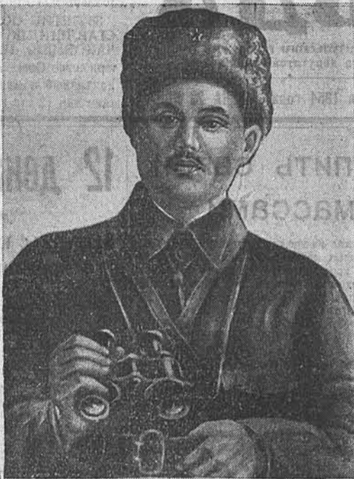
Е. М. Мамонов — командующий партизанской армией.