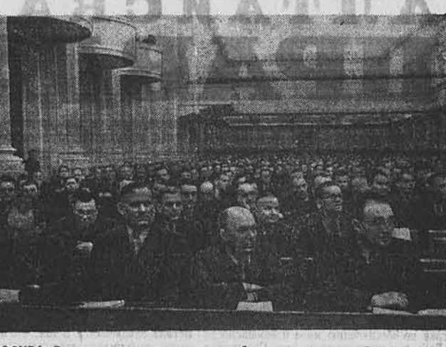
МОСКВА. Всесоюзное совещание строителей, архитекторов и работников промышленности строительных материалов, строительного и дорожного машиностроения, проектных и научно-исследовательских организаций, созданное ЦК КПСС и Советом Министров СССР. На снимке: в зале во время совещания.

План выращивания овощей в парниках и теплицах, при условии выполнения плана выращивания рассады, получают стоимость третьей части урожая овощей, собранного сверх установленного для звена плана, исходя из средней продажной стоимости этих овощей по колхозу.