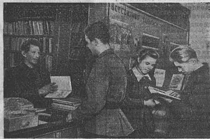
Загайновская сельская библиотека Троицкого района насчитывает в своих фондах 7.700 томов. Библиотека имеет четыре передвижки, 16 книгош. В этом году активно проведено на полях станах и в тракторных бригадах 500 читок, 50 бесед и 8 лекций.

Населению продано товаров на 23 миллиона рублей. Работники универмага за 10 месяцев сэкономили на издержках обращения 37 тысяч рублей.