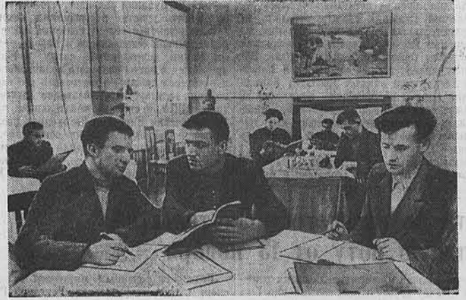
В Барнауле открыт новый индустриальный техникум трудовых резервов. На первом курсе принято 90 человек, еще совсем недавно сидевших за рулем трактора, водивших комбайны. Для учащихся созданы хорошие условия. Техникум имеет благоустроенное общежитие, столовую, читальный зал, большую библиотеку.