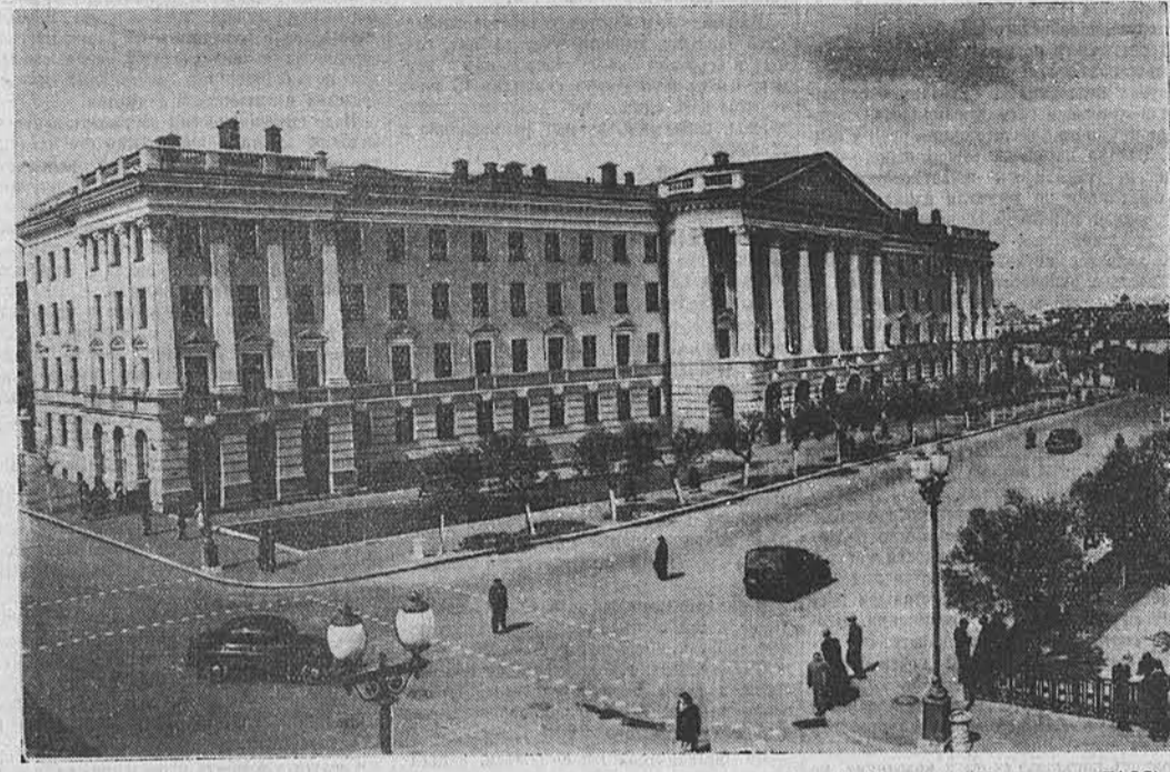
На снимке: один из корпусов Казанского университета.

Создана двухколесная грузовая коляска. Она прикрепляется к велосипеду с помощью специальной шарнирной подвески. Изготовлены новые модели женских велосипедов, машин для подростков. (ТАСС.)