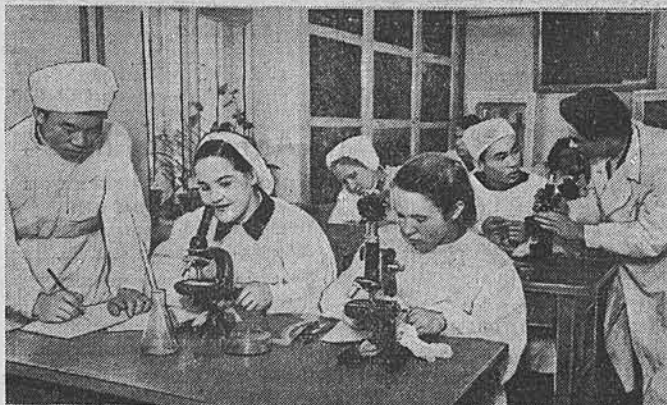
Скоро в Барнаульском медицинском институте начнется первая экзаменационная сессия. Студенты будут сдавать зачеты и экзамены по основам марксизма-ленинизма, анатомии, физике, химии, биологии. Сейчас студенты-медики усиленно готовятся к зимней сессии.

Включаясь в социалистическое соревнование, коллектив завода единодушно решил досрочно выполнить задание пятой пятилетки по выпуску валовой продукции к первому ноября 1955 года. Производительность труда в целом по предприятию намечено повысить на 64 процента к уровню 1950 года.