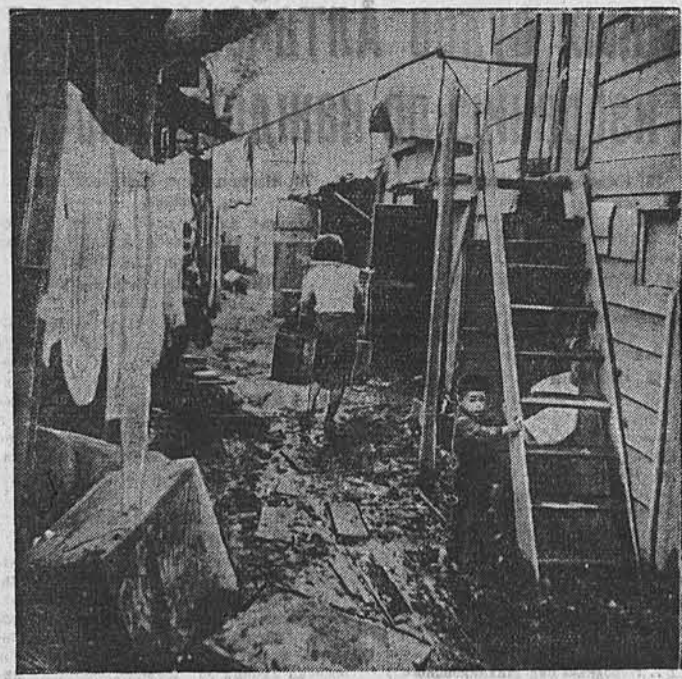
Токно. Жилье бедняка у парка Уэно.

ПРАГА, 12 ноября. (ТАСС). Как передает Чехословацкое телеграфное агентство, в течение пятилетки чехословацкая промышленность выпустила только для нужд чехословацкого сельского хозяйства 14,353 трактора. В ближайшие 2—3 года количество тракторов в чехословацком сельском хозяйстве значительно увеличится.