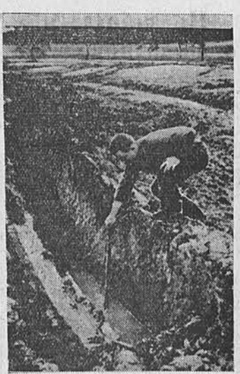
В Западной Германии недавно повелись маневры оккупационных войск. Маневры причинили заподозрительному населению крупные убытки. Значительные земельные площади были вытоптаны. В ряде мест участки были перерезаны траншеями, что сделало их неудобными для обработки. На снимке: вид местности в районе Вейлара после маневров.