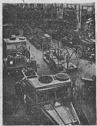
В Венгерской Народной Республике быстро развивается транспортное машиностроение. Заводы освоили производство нескольких типов электровозов, тепловозов, автомашин. Будущий завод «Чепель» производит для нужд народного хозяйства дизельные грузовики.

Уругвайская газета «Хустисиа» указывает, что недавний визит в Уругвай по инициативе государственного секретаря США по межамериканским делам Холлида тесно связан с предстоящей конференцией в Рио-де-Жанейро. Но, вопреки стараниям Холлида подчеркивает газета США, не удалось избежать разногласий на конференции.