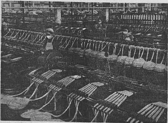
Китайский народ, возглавляемый Коммунистической партией Китая, ведет борьбу за превращение страны в великое социалистическое государство. На основе развития тяжелой промышленности и сельского хозяйства в Китайской Народной Республике широко развивается и легкая промышленность. Согласно плану, производство главных видов продукции текстильной промышленности в 1954 году увеличится по сравнению с 1953 годом следующим образом: производство хлопчатобумажной пряжи — на 11,24 процента, хлопчатобумажных тканей — на 12,6 процента, шерстяных трикотажных изделий — на 17,48 процента. Капитальное строительство в текстильной промышленности в 1954 г. будет расширено более чем в два раза против 1953 года. На снимке: в цехе Шанхайской государственной хлопчатобумажной фабрики № 2.