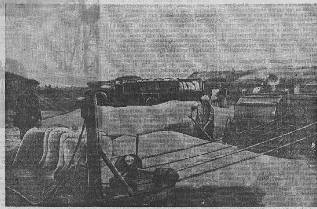
Днем и ночью кипит работа на току второй полеводческой бригады колхоза имени Ленина, одного из передовых по хлебозаготовкам в Рубиновском районе. Круглые сутки с тока уходят машины с зерном на элеватор. На снимке: ток второй бригады колхоза имени Ленина.