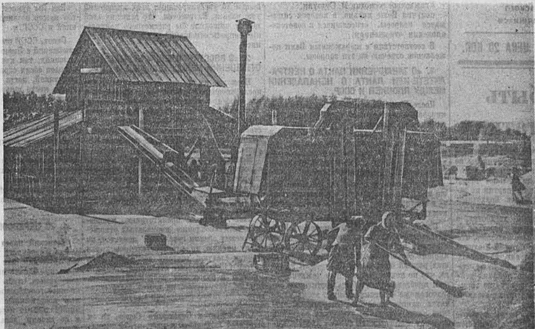
В Косихинском свеклосовхозе все поступающее от комбайнов зерно в тот же день очищается, просушивается и отправляется на заготовительный пункт. Это достигнуто благодаря широкой механизации работ на токах. На снимке: механизированный ток на первом отделении совхоза.

Борьба с потерями урожая — не частное дело, это — государственная, всенародная задача!