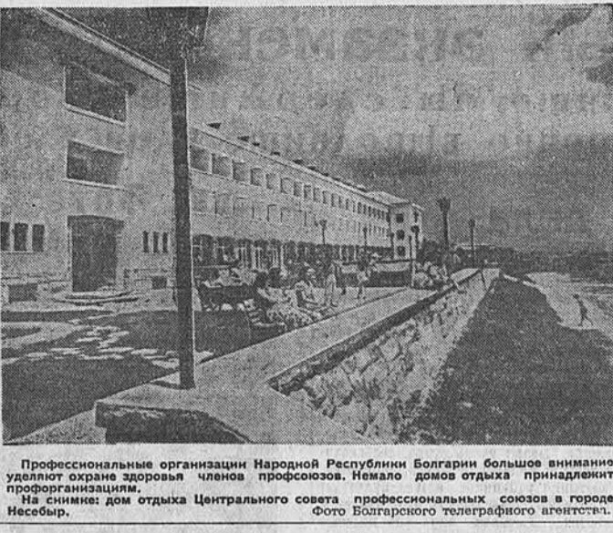
Профессиональные организации Народной Республики Болгарии большое внимание уделяют охране здоровья членов профсоюзов. Немало домов отдыха принадлежит профсоюзам. На снимке: дом отдыха Центрального совета профессиональных союзов в городе Несебыр.

ГААГА, 7 сентября. (ТАСС). Газета «Де фолкскрант» сообщает, что 6 сентября 800 амстердамских докеров объявили забастовку. Бастующие требуют повышения зарплаты на 6,5 гульдена в неделю.