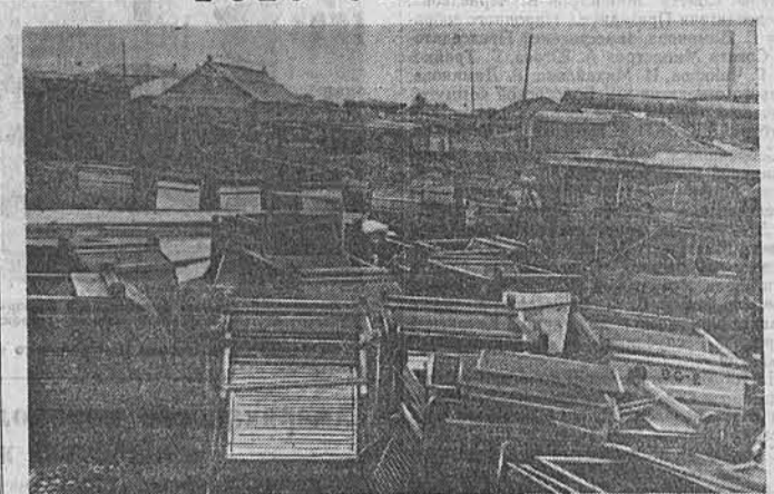
НА СНИМКЕ: один из уголков товарного двора станции Барнаул. На переднем плане велики. Они стоят здесь уже пять дней. 191 железу отпавил рижский завод «Иманта» в адрес Алтайского сельхознаба. Железнодорожники постарались без задержек доставить машины из Риги в Барнаул. Они понимают, что сейчас, в горячую уборочную пору, дорог каждый час, и надеются, что работники Сельхознаба примут все меры к тому, чтобы велики были быстро доставлены на колхозные токи. Но работники Сельхознаба не забывают об этом. Помещаемый выше снимок свидетельствует о нетерпимом отношении краевой конторы Сельхознаба (управляющий т. Тимофеев) к новой технике.