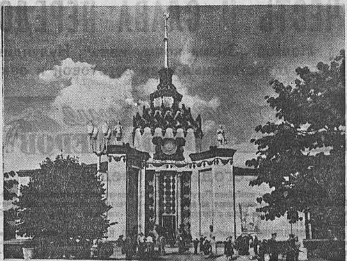
Всесоюзная сельскохозяйственная выставка. Павильон Центросоюза.