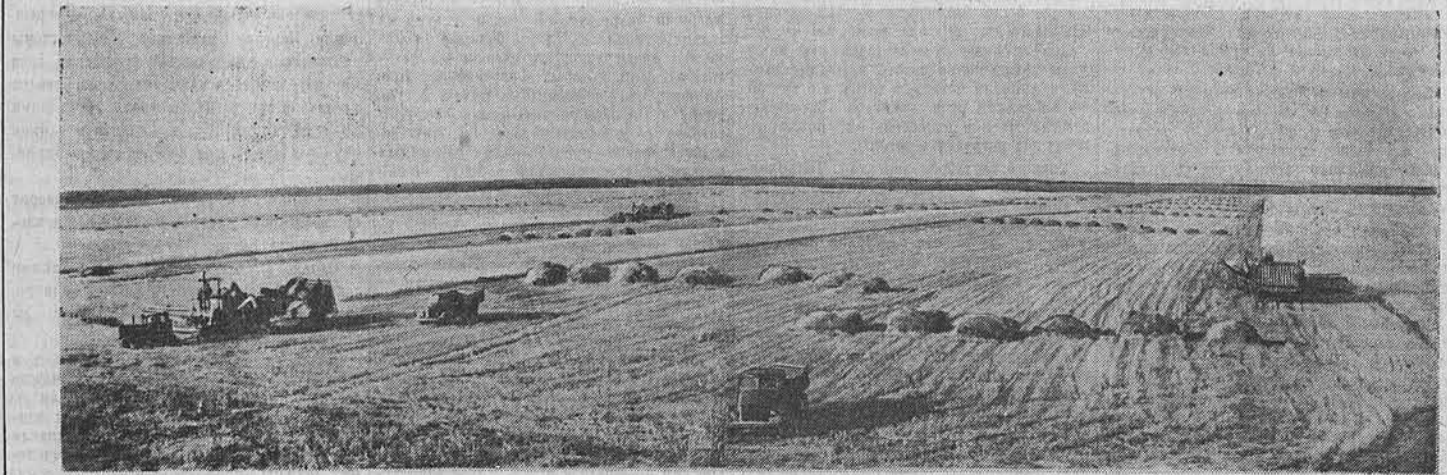
В Ново-Егорьевской МТС успешно применяется групповой метод работы комбайнов. Комбайнеры перевыполняют нормы выработки. На снимке: групповая работа комбайнов на полях колхоза имени Сталина.