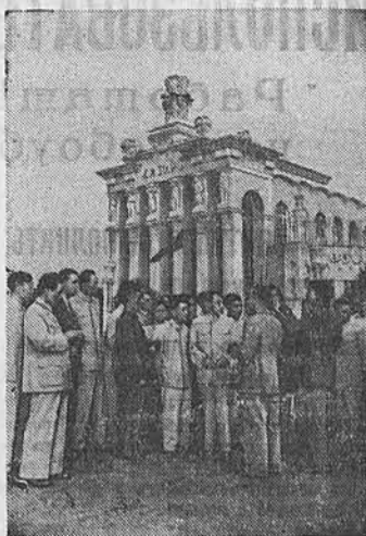
Во время пребывания в Москве профсоюзная делегация Китайской Народной Республики посетила Всесоюзную сельскохозяйственную выставку. На снимке: гости у павильона «Сибирь».