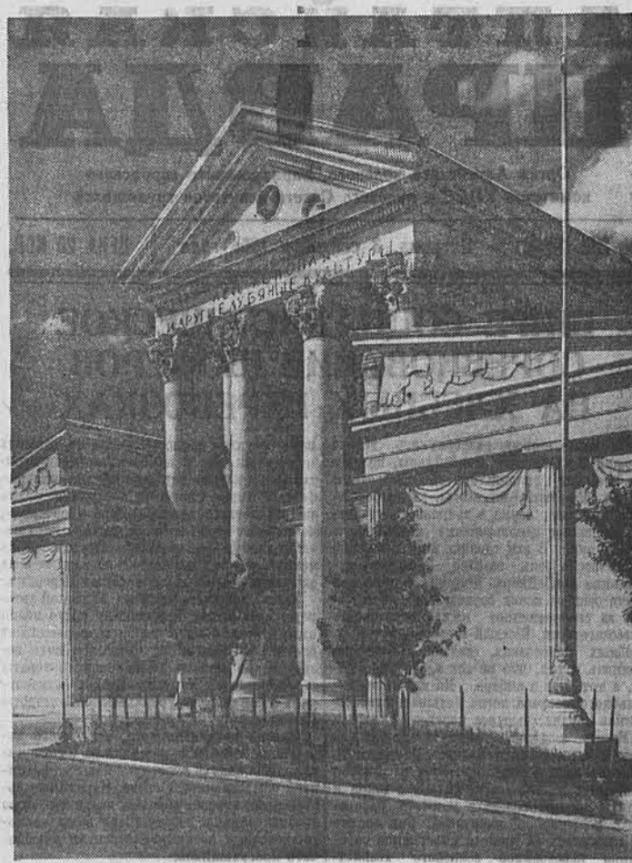
Всероссийная сельскохозяйственная выставка. На снимке: павильон льна, конопли и других лубяных культур.