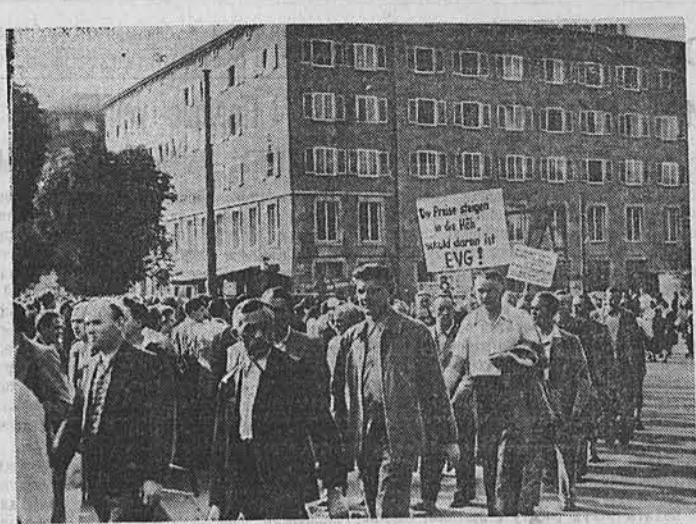
В Западной Германии трудящиеся усиливают борьбу за мир, за свои жизненные интересы. Недавно в Штутгарте бастовало более 30,000 рабочих металлообрабатывающих предприятий. Они требовали повышения заработной платы на 8 процентов.

Сегодня, 29 августа, СОСТОЯТСЯ БЕГА. Участвуют лучшие лошади края. Работают буфеты и тотализатор.