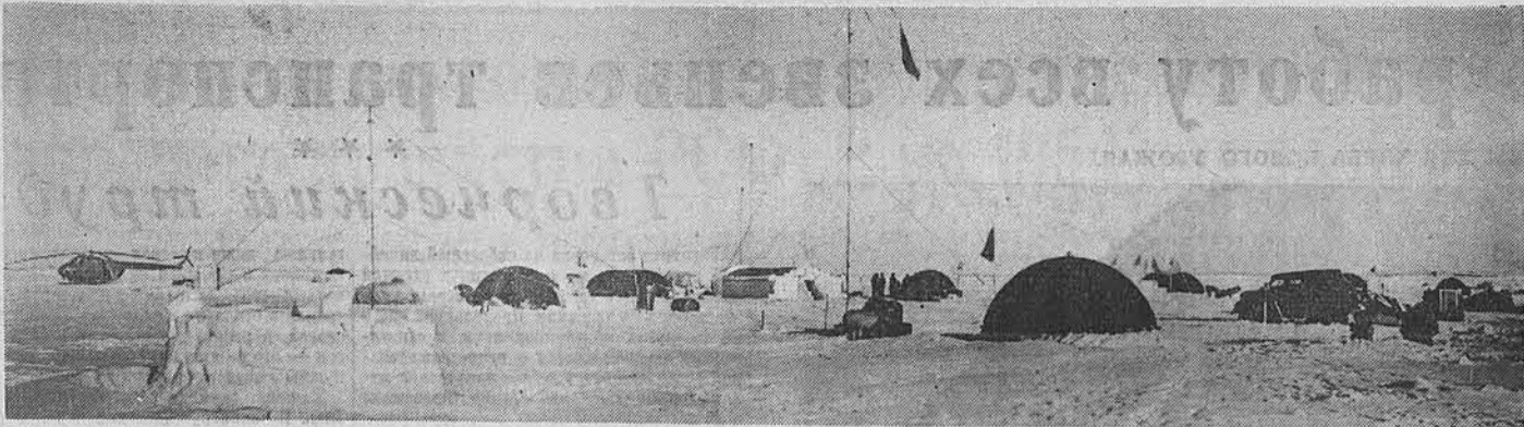
Лагерь дрейфующей научной станции на льдах Центральной Арктики.