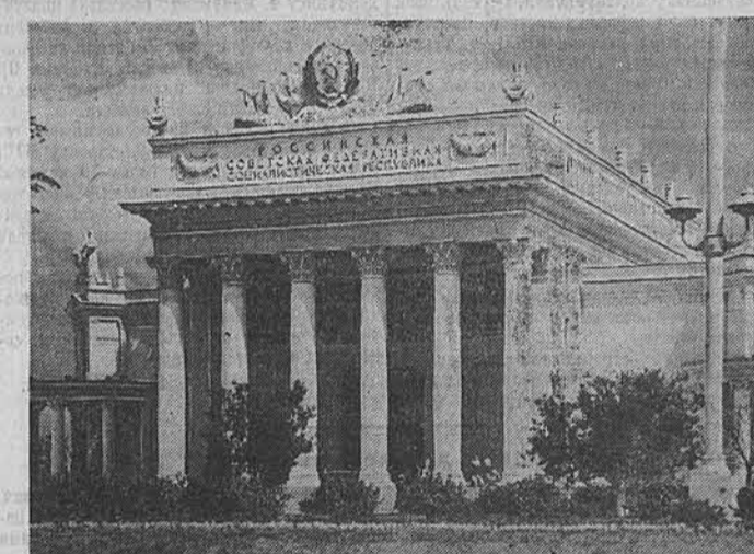
Павильон Российской Советской Федеративной Социалистической Республики.

Ожили животноводческие постройки выставки. Сюда перенесены после 30-дневного пребывания в карантине тысячи доставленных животных. Три фермы крупного рогатого скота, овцеводческая, свиноводческая и птицеводческая целиком переоборудованы на выставку. За ними установлен тщательный уход. Произведен пробный пуск павильонов-