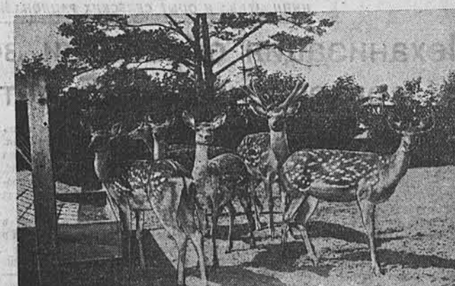
Москва. На Всесоюзную сельскохозяйственную выставку поступают многочисленные экспонаты. Среди них — вывозятся крупные рогатый скот, свиньи, овцы и другие животные. Из Алтайского края в числе других животных доставлены марьялы и пятнистые олени. На снимке: пятнистые олени, доставленные из Шабалинского оленеводческого совхоза Горно-Алтайской автономной области.

ЛОНДОН, 8 июля. (ТАСС). 7 июля советский посол в Великобритании Я. А. Малик устроил прием в честь находящихся сейчас в Англии советских гребцов и шахматистов, участвовавших в Международных соревнованиях по гребле и в шахматном матче.