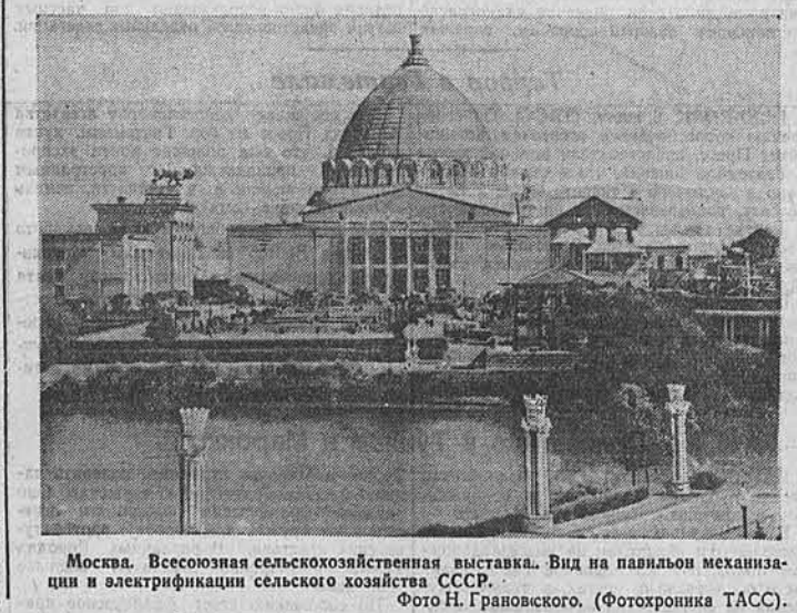
Москва. Всесоюзная сельскохозяйственная выставка. Вид на павильон механизации и электрификации сельского хозяйства СССР.