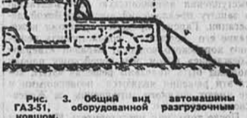
Рис. 3. Общий вид автомашин ГАЗ-51, оборудованной разгрузочным ковшом.