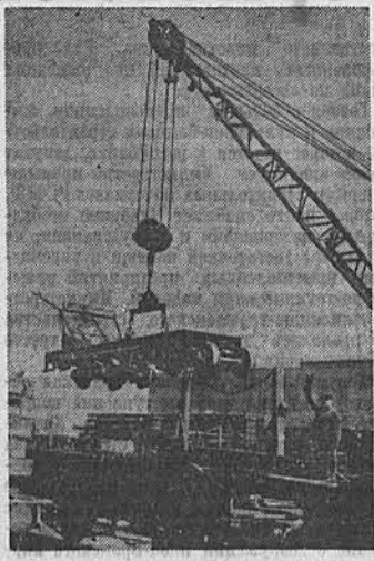
Алтайский вагоностроительный завод начал выпуск транспортеров для перевозки древесины в хлыстах. Транспортер состоит из двух сепаров. Грузоподъемность его — 34 тонны. На снимке: погрузка транспортеров, отправляемых в лесхозы.