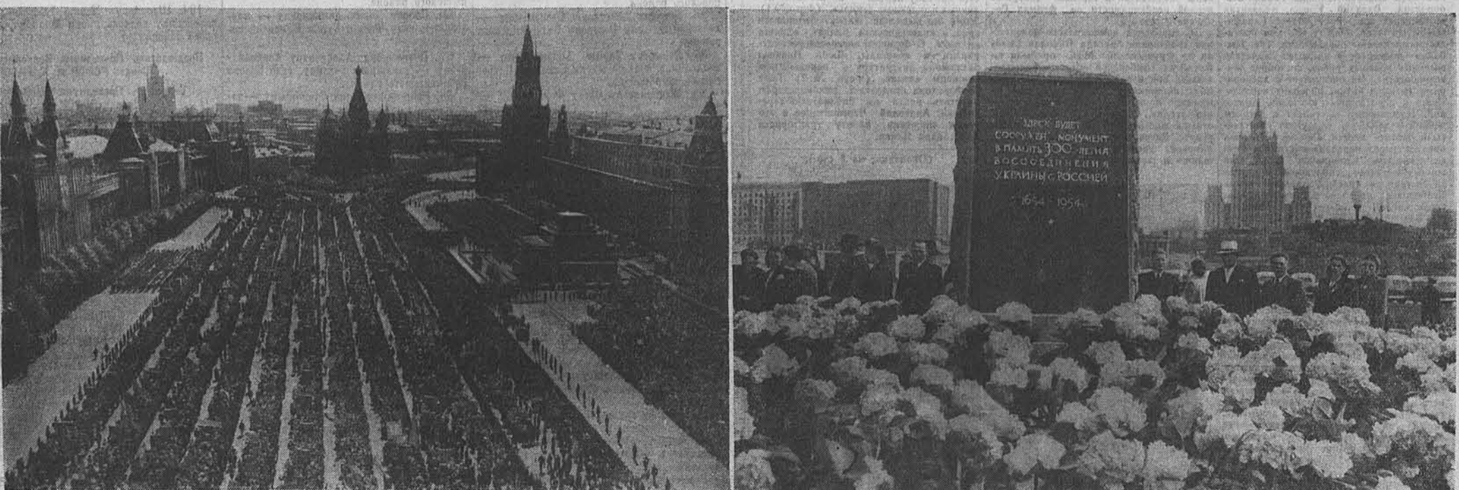
Москва, 30 мая. Празднование 300-летия воссоединения Украины с Россией. Демонстрация представителей трудящихся на Красной площади.

Президиум Верховного Совета РСФСР Совет Министров РСФСР