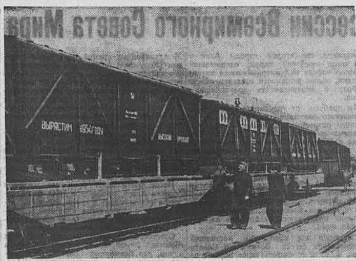
В этом году Алтайский вагоностроительный завод изготовит 350 вагонов для тракторных бригад, осваивающих целинные земли...

Павловск. (Наш соб. корр.) Коллектив рабочих Павло-Завольского МТС готовится к сенокосу в обслуживаемых колхозах. 27 прицепных сенокосилок и одна самоходная отремонтированы.