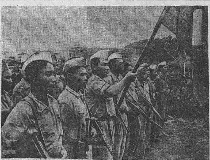
В процессе героической борьбы за мир и независимость страны правительство сопротивлялось Патет-Лао, одного из трех демократических государств Индо-Китая, создало народную армию освобождения. На снимке: один из отрядов народной армии Патет-Лао.