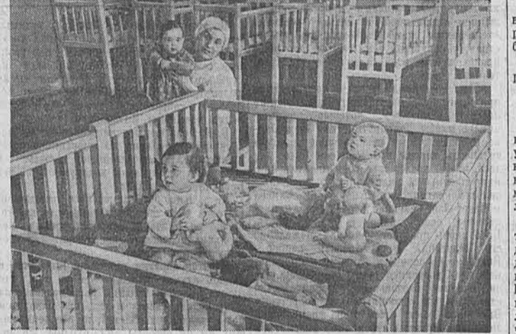
Благоустроенное, хорошо оборудованное помещение выделено под детские ясли в сельхозартеле имени Молотова, Шинюловского района. Здесь созданы все условия для правильного воспитания детей. Матери-колхозники, занятые на общественных работах, спокойны за своих малышей. На снимке: в детских яслях колхоза имени Молотова.

обсуждалась на бюро райкома партии и общем собрании колхозников сельхозартеля имени Сталина. Секретаря райкома партии по зоне Златопольской МТС т. Голубева бюро райкома обязало немедленно выехать на постоянное жилище в МТС, а структура по этой же зоне т. Глебова — в колхоз имени Сталина.