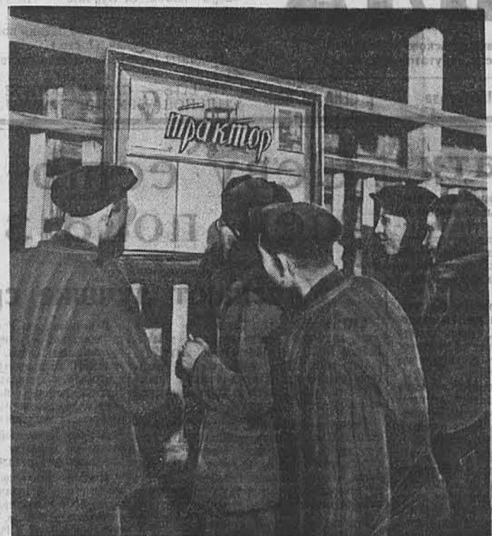
Регулярно выходит стенная газета «Трактор» в Ребрихинской МТС. На снимке: рабочие читают свежий номер стенной газеты.

редактор многотиражной газеты «За Родину», Барнаульский завод транспортного машиностроения.