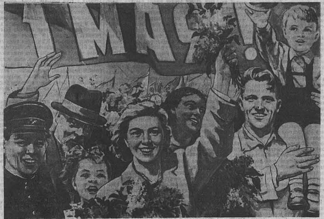
Плакат художника Н. Ватолиной.

Для ускорения начала навигации речники провели через усть-каменогорский шлюз в Иртышское море ледокол «Иртыш». Судно взломало лед в нижнем подходе канале и вчера вышло в горное водохранилище. Здесь, во льдах метровой толщины, оно пробивает путь для речных судов, везущих посевные грузы колхозам и МТС глубинных районов Восточного Казахстана.