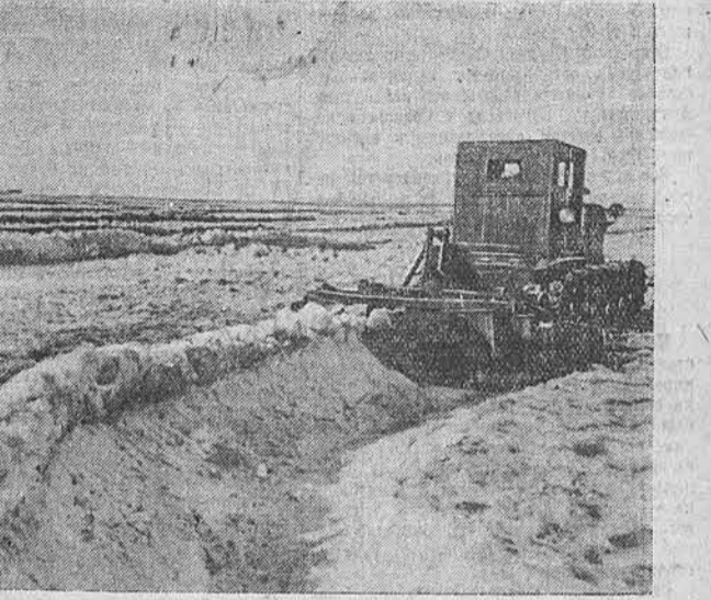
В колхозах «Большевик», Калманского района, и имени Ленина, Рубцовского района, хорошо организовано задержание талых вод. Помня о том, что задержание талых вод обеспечивает значительную прибавку урожая, а иногда и полностью решает его судьбу, хлеборобы используют различные средства накопления весенней влаги на полях. На снимках: слева — задержание талых вод в колхозе «Большевик», справа — трактор со снегопахом на полях колхоза имени Ленина.