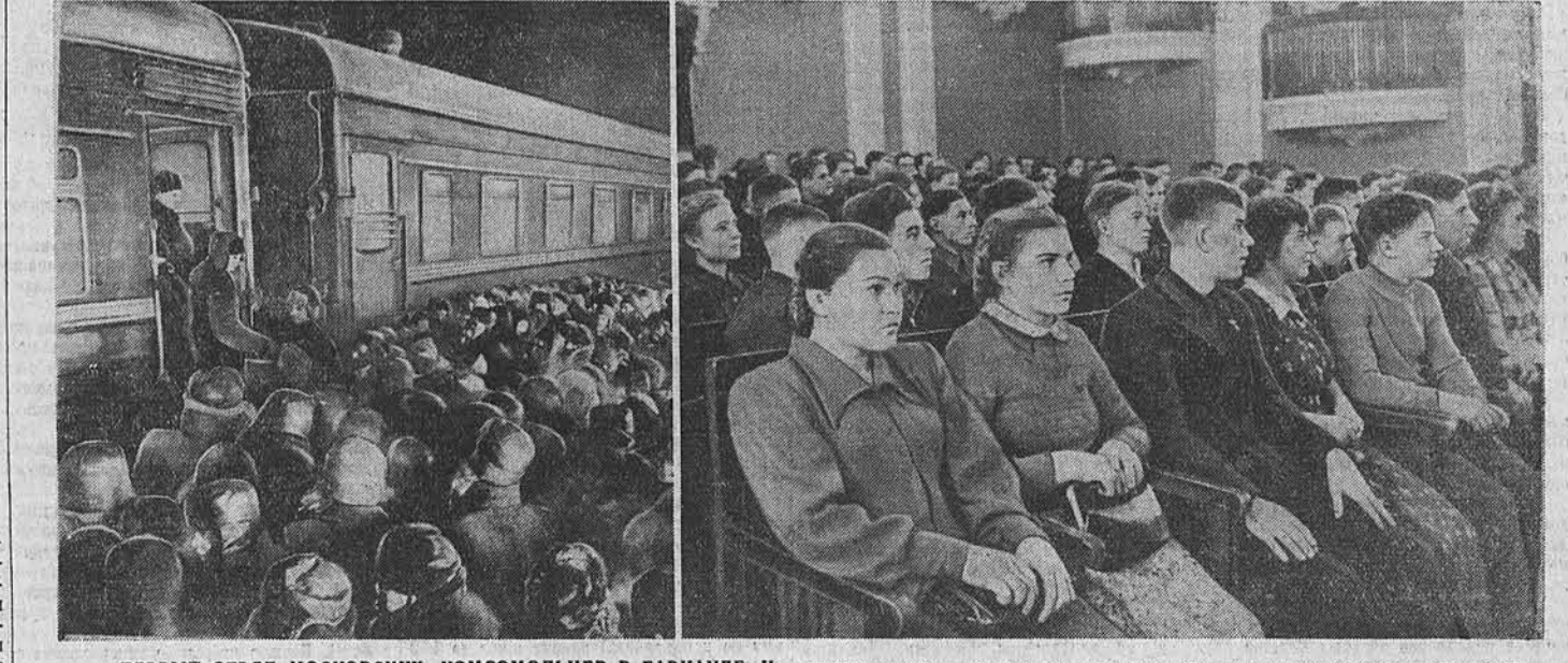
ПЕРВЫЙ ОТРЯД МОСКОВСКИХ КОМСОМОЛЬЦЕВ В БАРНАУЛЕ. На снимках: слева — встреча на вокзале, справа — московские комсомольцы в зале крайкома КПСС.

27 февраля из Москвы на освоение целинных и залежных земель выехали еще три группы комсомольцев столицы и области. Новый отряд механизаторов Подмошья выехал со своими товарищами, находящимися в пути, отправился на Алтай. Большая группа молодых рабочих столичных предприятий и строек выехала в степные районы Казахстана. Москва тепло проводит в путь патриотов, решивших со всем жаром комсомольских сердец взяться за новое дело. В ряды энтузиастов вливаются все новые и новые отряды молодежи. В Москве и Московской области уже около 40 тысяч юношей и девушек подали заявления с просьбой послать их осваивать целинные земли. (ТАСС)