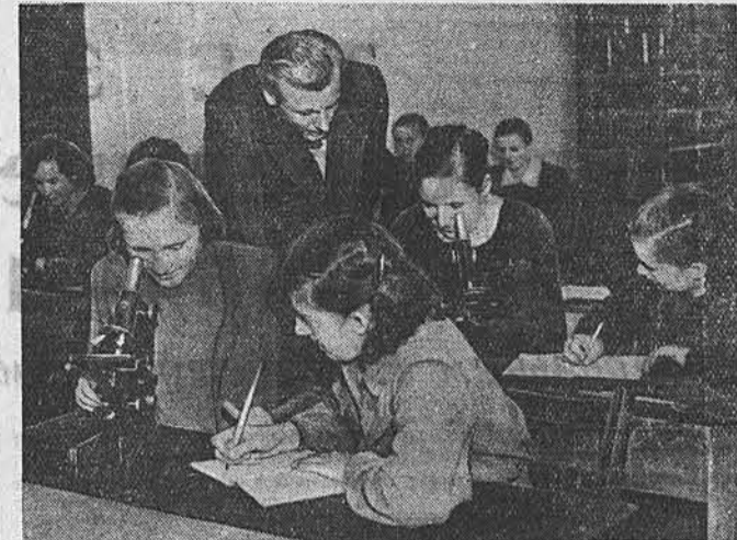
В Польской Народной Республике имеется 5 высших и около 150 средних учебных заведений, которые готовят агрономов и зоотехников. В воеводствах существуют, кроме того, начальные сельскохозяйственные школы...