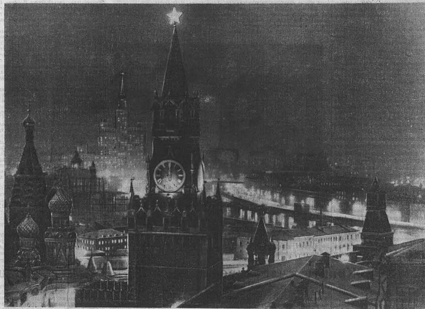
Москва в новогоднюю ночь.

С Новым годом, дорогие товарищи! Под знаменем Ленина — Сталина, под руководством Коммунистической партии — вперед, к торжеству коммунизма!