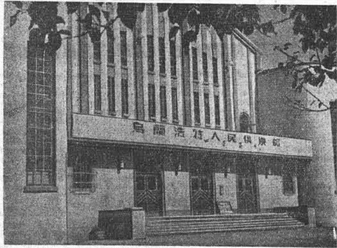
Китайская Народная Республика. Улан Хота, что по-монгольски означает «Красный город», — один из самых молодых в Автономном районе Внутренняя Монголия. В этом городе, насчитывающем 30 тысяч жителей, живут представители национальных меньшинств Китайской Народной Республики: монголы, хуэй, корейцы. Здесь открыты учебные заведения, клубы и другие культурно-просветительные учреждения. На снимке: народный клуб в Улан Хота.