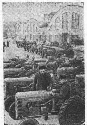
ХАРЬКОВ. Завод сельскохозяйственного машиностроения увеличивает выпуск машин. Больших успехов добился тракторосборочный завод. С начала года коллектив предприятия дал стране сверх плана сотни тракторов. На снимке: подготовка тракторов «ХТЗ-7» к отправке.

Да здравствует нерушимая дружба и союз советского и чехословацкого народов! Да здравствует и пусть становится все более мощным славный Советский Союз, да здравствует и процветает непобедимый героический советский народ!