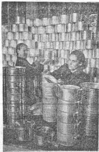
ЛЕНИНГРАД. Коллектив цеха ширпотреба Кировского завода выпускает кухонную посуду из алюминия. Ежемесячно более 15 тысяч изделий восьми наименований передается торговым организациям.

Всего в прениях выступило 10 человек. Собрание наметило мероприятия по улучшению политической учебы коммунистов.