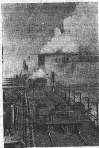
Запорожский коксохимический завод из года в год увеличивает выпуск кокса. Этому содействует механизация производственных процессов. На снимке: механизированные вагоны для загрузки углем коксовых печей.