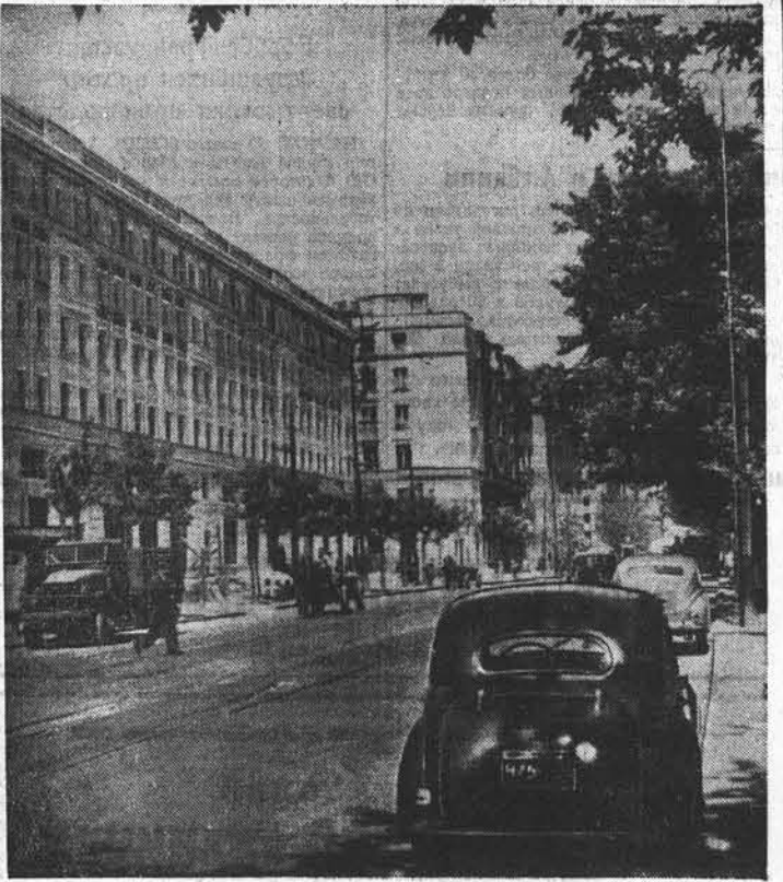
Польская Народная Республика. Новые жилые корпуса на Маршалковской улице Варшавы.

демократической Польши занимают гигантские работы по возрождению Варшавы. Усилиями строителей польская столица быстро поднимается из руин и в ближайшие годы станет еще более красивой и благоустроенным городом, чем раньше.