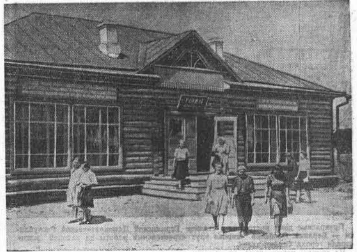
В селе Майма, Горно-Алтайской автономной области, ведется большое культурно-бытовое строительство. Только в этом году здесь построено много жилых домов, раймаг, контора райпотребсоюза. Сейчас заканчивается строительство районной больницы на 30 коек, в скором времени вступит в строй магазин хозяйственных товаров. На снимке: новый раймаг в селе Майма.

А. БОРНОВ. (Наш соб. корр.). Рубцовский район.