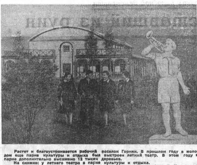
Растет и благоустривается рабочий поселок Горник. В прошлом году в молодом еще парке культуры и отдыха был выстроен летний театр. В этом году в парке дополнительно высажено 12 тысяч деревьев. На снимке: у летнего театра в парке культуры и отдыха.

В. КОЛЧУЖНЫЙ, бригадир овощеводческой бригады колхоза «Красный Восток», Ключевской район.