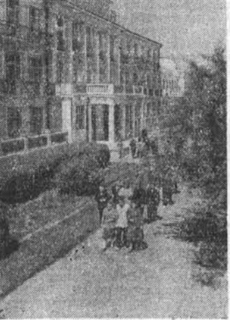
Одесса. Свыше ста тысяч трудящихся ежедневно отдыхают в здравницах города. Только в санаториях Одесского курортного управления ВЦСПС отдохнут в этом году 36 тысяч человек. На снимке: один из корпусов санатория ВЦСПС № 5 на Пролетарском бульваре. Здесь отдохнут в этом году семь тысяч трудящихся.

На снимке: один из корпусов санатория ВЦСПС № 5 на Пролетарском бульваре. Здесь отдохнут в этом году семь тысяч трудящихся.