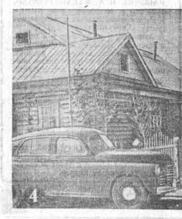
В отделе от общежития здания помещаются кухня и столовая. Для полевых и механизаторов организовано общественное питание. Труженики полей всегда получают вкусные обеды, сытные завтраки и ужины.

Во второй полеводческой и обслуживающей ее тракторной бригаде — большое хозяйство. Посевная площадь — две тысячи гектаров. Бригады отлично справляются с производственными заданиями. Сверх плана засеяно 200 гектаров пшеницы, успешно идет погем паров. Ничего полевых и ме-