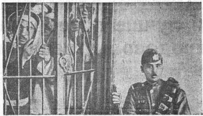
С Ираком никто не ведет войны. Однако правители Ирака, следуя указанию англичан, ввели в стране военное положение. Они воюют с демократическими партиями и организациями, борющимися за национальную независимость страны. Оппозиционные партии распущены. Патриоты бросают в тюрьмы. На снимке: арестованные патриоты Ирака.

СОФИЯ, 24 апреля. (ТАСС). По сообщению болгарского телеграфического агентства в Греции в течение пяти месяцев, то есть со времени прихода к власти правительства Палагоса, уволено с предприятий и из учреждений 50 тыс. служащих.