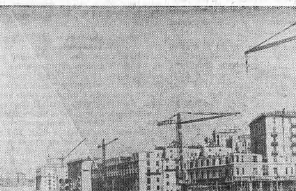
Киев строится. В послевоенные годы жители столицы Украины — Киева получили более полутора миллионов квадратных метров новой жилой площади.

КЕМЕРОВО, 13 апреля. (ТАСС). Из Киселевска и Сочи вернулась группа стахановцев шахты «Центральная» Кемеровского рудника. В первом квартале с одной этой шахты в санаториях побывало 22 человека. Всего в домах отдыха и санаториях в нынешнем году уже отдохнуло около пяти тысяч шахтеров бассейна.