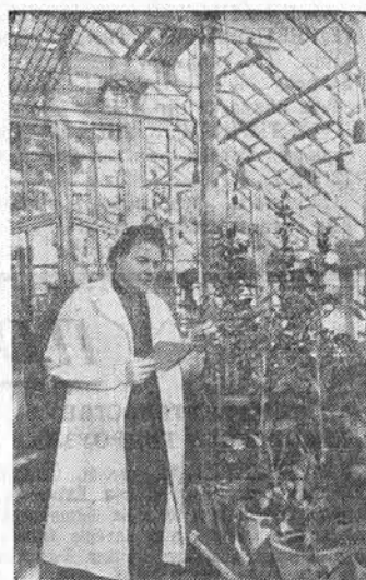
УРАИНСКАЯ ССР. В ноябре 1952 года руководители партии и правительства во главе с М. В. Сталиным пришли в Кремль к колхознику ударнику сельскохозяйственных полей.