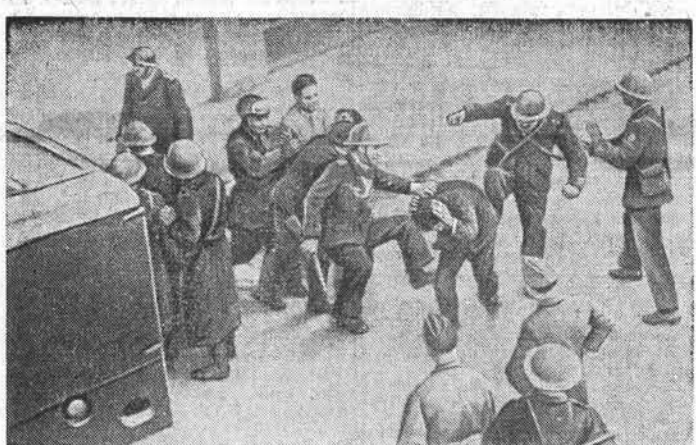
Марокко. Французские «охраняющие войска» и полицейские жестоко расправляются с патриотами, борющимися за национальное освобождение страны, против империалистического ига.

На снимке: группа вооруженных солдат «охраняющих войск» зверски избивает безоружного марокканца за то, что он осмелился принять участие в демонстрации, требовавшей предоставления Марокко национальной независимости.