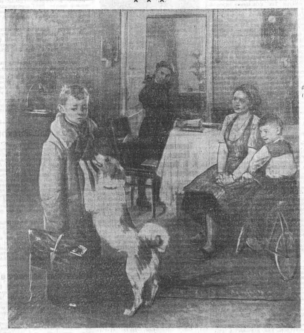
«Опять двойка». Работа художника Ф. П. Решетникова. Всесоюзная художественная выставка 1952 г.