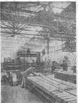
Венгерская Народная Республика. В одном из цехов завода железнодорожного оборудования в Дьбидеше.

РИМ, 28 февраля. (ТАСС). Председатель Союза итальянских женщин Мария Маддалена Росси сообщила, что 26 и 27 марта в Риме будет происходить «Национальный съезд итальянских женщин», составленный союзом для изучения всех проблем, интересующих женщин. Росси отметила, что этот съезд открыт для женщин всех политических убеждений и вероисповедания, и призвала женские католические организации сотрудничать с Союзом итальянских женщин для обеспечения успеха этого съезда.