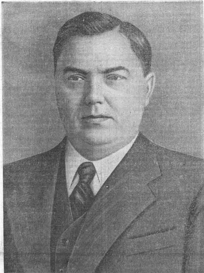
Георгий Максимилианович Маленков.

Выражение горячей любви и преданности вождю