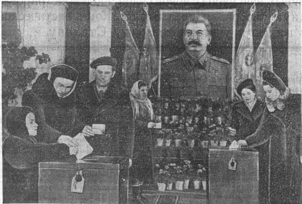
На снимке: момент голосования на избирательном участке № 37 гор. Барнаула.