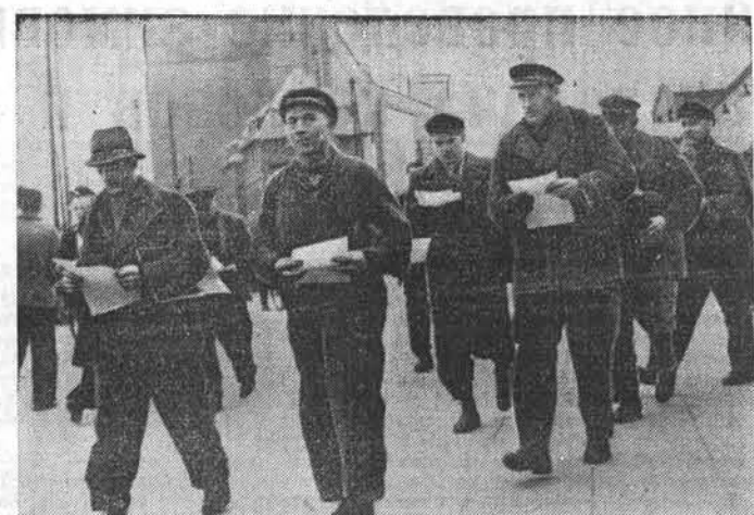
Западная Германия. Коммунистическая партия Германии и прогрессивные организации ведут большую работу по разъяснению широкому массам населения Германии, разоблачают антинациональную политику боннского правительства. На снимке: рабочие завода акционерного общества «Везер» в Бремене с листовками, призывающими немецкий народ бороться за мирный договор и за объединение Германии.

ВАРШАВА, 19 февраля. (ТАСС). Вчера военный районный суд в Варшаве, рассматривая дело американских шпионов, после оглашения обвинительного заключе-