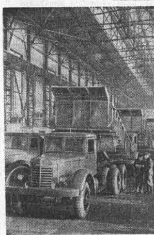
Ярославский автомобильный завод досрочно завершил квартальный план сборки 10-тонных автосамосвалов «ЯАЗ-210-Е». Выпуск грузовых автомобилей непрерывно увеличивается. В этом году их будет изготовлено в два раза больше, чем в прошлом. На снимке: в сборочном цехе.

ДЕРБЕНТ, 18 февраля. (ТАСС). В садах и на виноградниках ведется посадка плодовых деревьев. С каждым днем все шире развертываются полевые работы. Колхозы Магарамкентского района первыми приступили к севу яровой пшеницы.